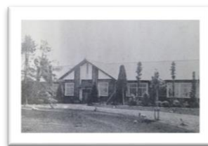
施設の近景で 100 年の歴史を振り返る

少年院(矯正院)設立・廃止等一覧(2023年3月現在) 少年院関係略年表 統計 少年院(矯正院)新収容者数 少年院入院者非行名別(男子) 少年院入院者非行名別(女子) 少年院入院者の教育程度 少年院入院者の保護者の状況 少年院出院時引受人