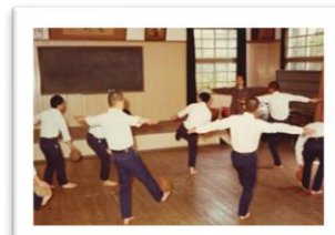
少年の日々の暮らし、 学びの様子写した写真も多数掲載